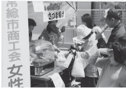
▲出店したグルメショップでの販売の様子

場所：常総市商工会 水海道事務所 午前10時~午後2時まで 相談は無料です 予約先：下館年金事務所相談室 ☎0296-25-0834