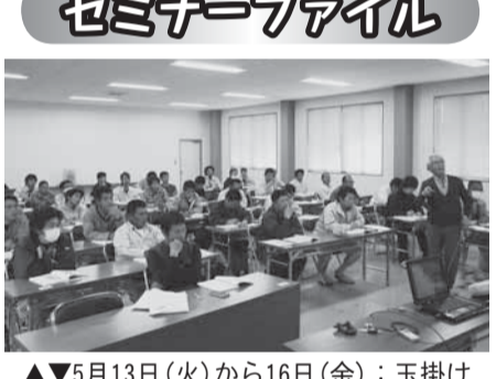
▲▼5月13日(火)から16日(金)：玉掛け技能講習会(受講者35名)

各分野で長い経験や実績を持つ専門家が登録されており、無料で指導が受けられるもので、主な具体的支援テーマについては次の通りです。 ◇経営戦略◇販路開拓販売促進◇創業、経営革新◇ ◇税務◇組織、待遇◇デザイン、広告◇特許、商標◇生