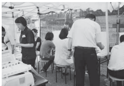
▲昨年行われた献血会場での様子

当女性部でもグルメショップに出店し、マーガレットやガーベラなどの「鉢植え」と「さつま揚げ」を販売。当日は天気も良く会場を訪れた多くの方々に対し女性部活動をアピールしました。