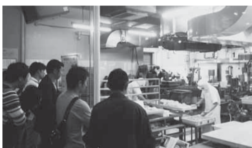
▲2日間での工場見学(上)や釣り(下)を通じ見聞と親睦を深めた参加者の皆さん

釣堀では、参加者全員が鯛や鱈を釣りあげ、釣りあげた魚は宿泊先にて舟盛りにして頂き食すと共