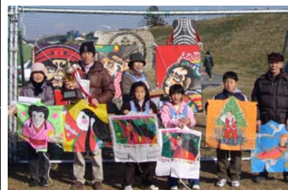
前回入賞された皆さん 作品を手に記念写真

平成19年1月7日（日）＜雨天時1月8日（祝）＞10時～14時 「コンテスト（地上審査及びあげ方審査）」→「昼食（豚汁、おにぎり等用意）」→「デモフライト」→「審査結果発表」→表彰式