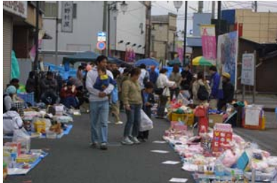
約40店の出店で賑う会場