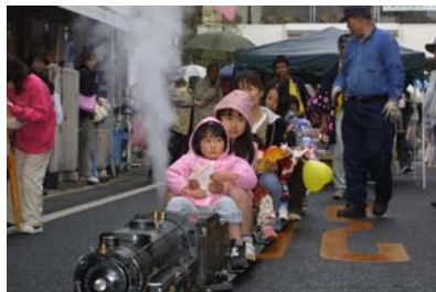
行列ができるほどの大盛況