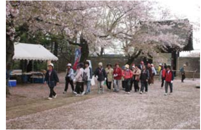
桜のじゅうたんを歩く参加者